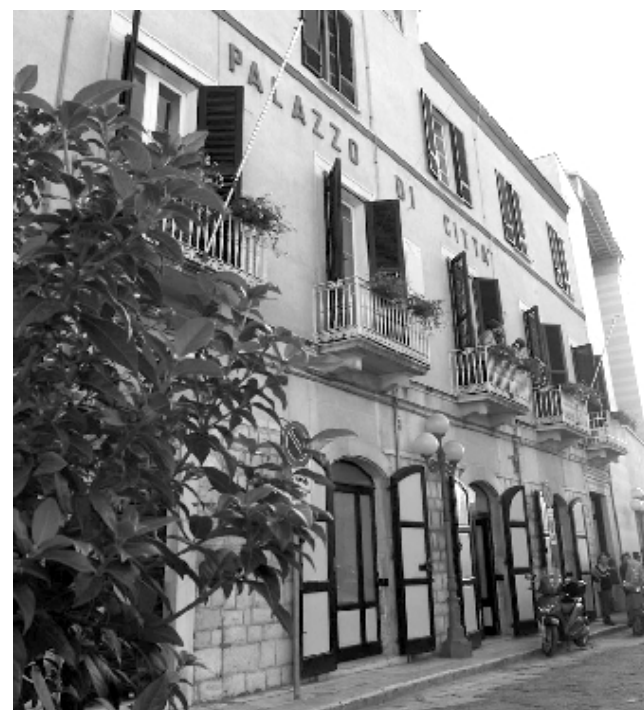
Difensore civico, la nomina è in alto mare

L'amarezza si trasforma in rabbia se per un attimo ci si ferma a riflettere sulla circostanza che impedisce, ad oggi, l'istituzione del difensore civico. Occorre, infatti, (ed è possibile farlo in pochissimi giorni) indire, da parte del presidente della quinta commissione consiliare permanente, l'assemblea dei soci delle libere forme associative, registrate da tempo nell'albo comunale. Nel corso dell'assemblea dovrà avvenire l'elezione delle quattro consulte cui, fra i tanti compiti assegnati, spetta quello di approvare l'elenco contenente non meno di cinque nominativi, fra i quali successivamente il consiglio comunale dovrà e-