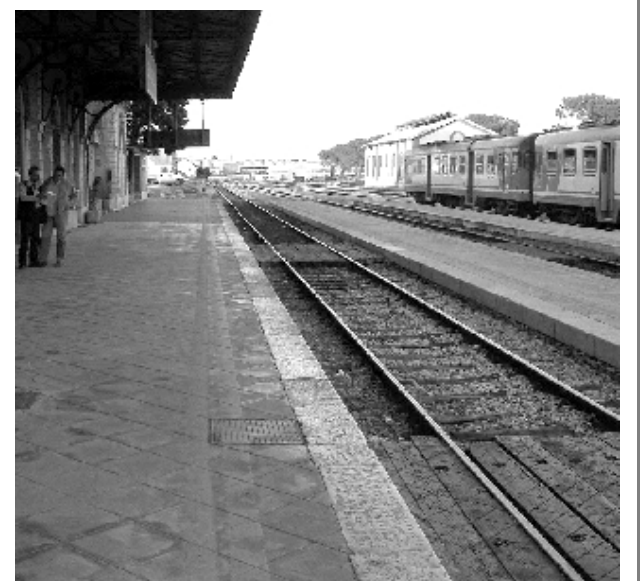
Ferrovie Barletta-Spinazzola, protestano i pendolari

E ancora: distanze coperte in troppo tempo, almeno due ore e mezzo per arrivare da Minervino al capoluogo. D'altro canto si tratta di corse poche frequentate e ciò, nell'ottica della razionalizzazione